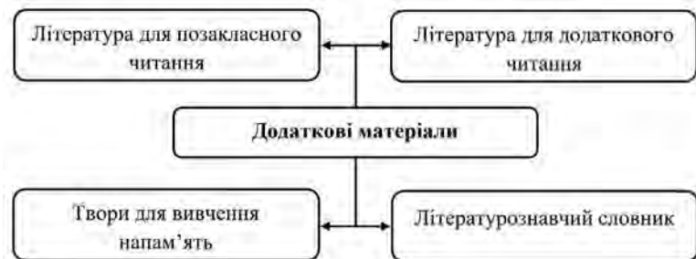
Рис. 2. Додаткові матеріали мультимедійної онлайн-платформи з української літератури

Перевагою мультимедійної онлайн-платформи з української літератури для здобувачів освіти 8 класу є те, що учні мають доступ до додаткових матеріалів. Використовувати подані в цій рубриці матеріали можна у будь-який час, наприклад, літературознавчий словник під час вивчення термінів з теорії літератури, а літературу для додаткового читання у момент вивчення творчості українських письменників. Особливо корисними вони будуть для здобувачів освіти, які цікавляться філологією, інтелектуально обдарованій молоді, що має хист до гуманітарного циклу дисциплін. Рубрика додаткових матеріалів мультимедійної онлайн-платформи представлена на рис. 2: